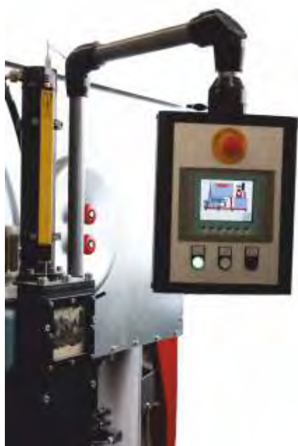
Kontrollpanel zur Steuerung und Programmierung der Brikettierpresse mittels Touch-Screen