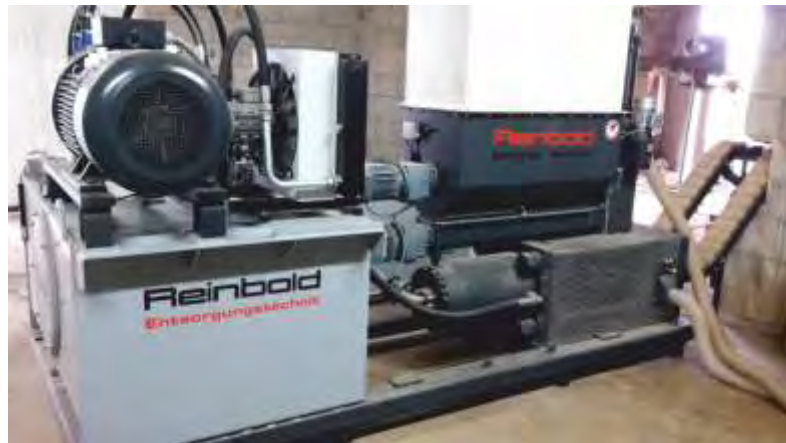
RB 600 RS in Siloausführung