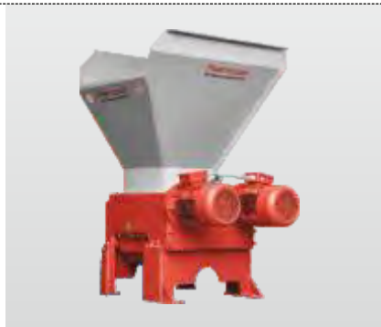
Baureihe RMZ 500 - RMZ 1000 S: der Vierwellenzerkleinerer, ideal zum Zerkleinern von langen Teilen