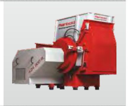
Baureihe AZR 600 K - AZR 2000 K Gigant: der Einwellenzerkleinerer für die effektive Kunststoffzerkleinerung