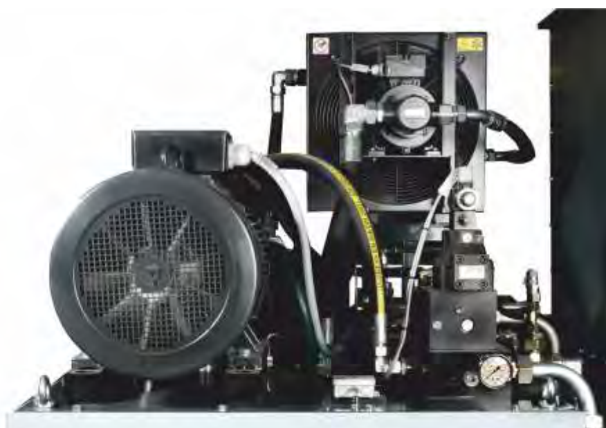
Hydraulikaggregat mit Axialkolbenpumpe und Kühlung für den Mehrschichtbetrieb

Die Brikettierpresse RB 400 RS - RB 600 RS – zuverlässige und leistungsfähige Brikettiertechnik für die industrielle Herstellung von eckigen Briketts zur Volumen-reduzierung oder thermischen Verwertung. Die sehr gute Packdichte der eckigen Briketts ist optimal bei der Lagerung oder dem Transport. Außerdem haben die hochverdichteten Briketts ein sehr gutes Abbrandverhalten. Lassen Sie sich beraten, wie Ihr Material optimal brikettiert werden kann.