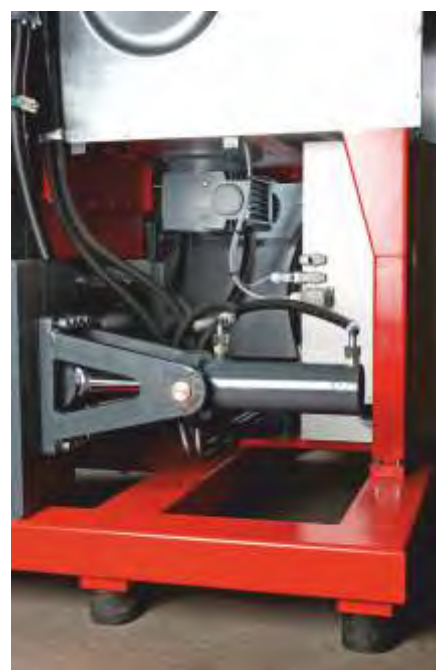
Leistungsstarke Hydraulikzylinder, Getriebemotor für das Rührwerk und die Förderschnecke