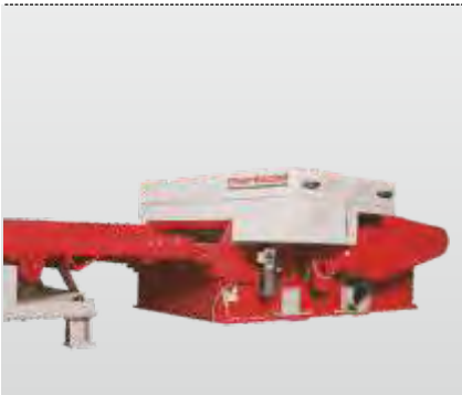
Baureihe RHZ 300 - RHZ 1300 Gigant: der Horizontalzerkleinerer für die horizontale Beschickung der Maschine