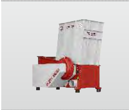
Baureihe AZR 600: der Universalzerkleinerer für Schreinereien