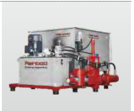
Baureihe RB 100 - RB 300 Flexibel S: zur Brikettierung von Materialspänen

Durch die langjährige Erfahrung in der Wertstoffzerkleinerung und Brikettierung kann Reinbold mit seinem umfangreichen Maschinenprogramm optimale Lösungen für die verschiedensten Anwendungen in der Zerkleinerung und Brikettierung bieten. Für Versuche mit Ihrem Material steht Ihnen unser Technikum zur Verfügung.