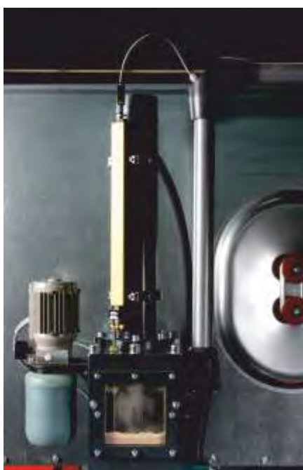
Wegemeßsystem zur Steuerung der Abläufe des Zylinders und der Pressmatrize. Daneben die Zentralschmieranlage