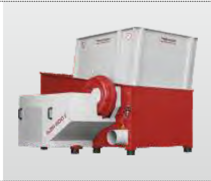
Baureihe AZR 800 - AZR 2000 Gigant: der Einwellenzerkleinerer für die professionelle Zerkleinerung