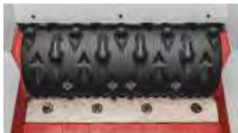
Versión del rotor 8 (Ø cuchillas 30 mm)

Diferentes Ø de rotor: 500 mm, 354 mm y 252 mm para las aplicaciones y rendimientos de paso más diversos