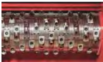
Versión del rotor 5

El sistema de cuchillas circular; Cuchillas que reducen sus gastos de explotación! Las coronas de las cuchillas circulares afiladas cóncavas posibilitan un mayor paso con muy poca fuerza gracias a un eficiente corte de tijera. Los portacuchillas están montados o soldados en el rotor perfilado. Con escasos movimientos manuales, las cuchillas pueden girarse y voltearse hasta 8 veces antes de que sea necesario recambiarlas.