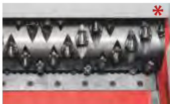
Versión del rotor 7 (Ø cuchillas 40 mm)

Diferentes Ø de rotor: 500 mm, 354 mm y 252 mm para las aplicaciones y rendimientos de paso más diversos