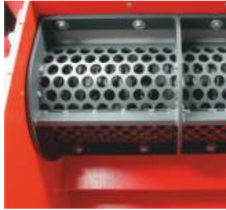
Elek delikleri çıkış malzemesinin boyutunu belirler