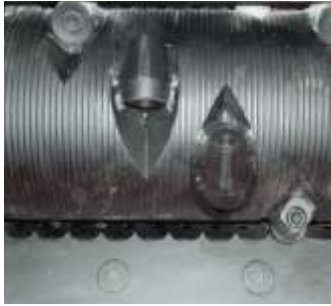
Şaft kaynaklı 30 mm'lik yuvarlak bıçaklar

AZR 50 Primus tek şaftlı kırıcıların başlangıç modelidir. Maksimum fayda minimum maliyet oranı ile küçük miktarlarda atıklar için uygun fiyatlı, tek şaftlı parçalayıcı makinedir.