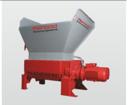
Baureihe RMZ 500 RMZ 1000 S: der Vierwellenzerkleinerer, ideal zum Zerkleinern von langen Teilen

Durch die langjährige Erfahrung in der Wertstoffzerkleinerung und Brikettierung kann Reinbold mit seinem umfangreichen Maschinenprogramm optimale Lösungen für die verschiedensten Anwendungen in der Zerkleinerung und Brikettierung bieten. Für Versuche mit Ihrem Material steht Ihnen unser Technikum zur Verfügung.