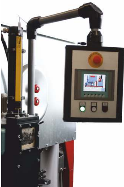
Kontrollpanel zur Steuerung und Programmierung der Brikettierpresse mittels Touch Screen