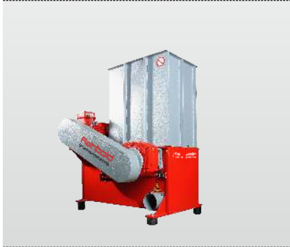
Baureihe AZR 50 Primus: das Einstiegsmodell in die Zerkleinerungstechnik mit Schubladenvorschub