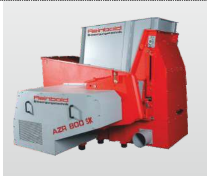
Baureihe AZR 600 K 2000 K S Gigant: der Einwellenzerkleinerer für die effektive Kunststoffzerkleinerung