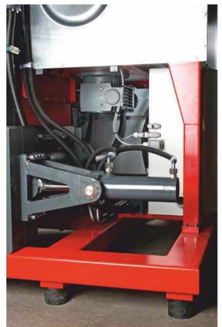
Leistungsstarke Hydraulikzylinder, Getriebemotor für das Rührwerk und die Förderschnecke