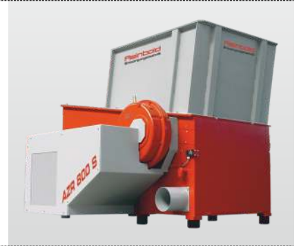
Baureihe AZR 800 2000 S Gigant: der Einwellenzerkleinerer für die professionelle Zerkleinerung