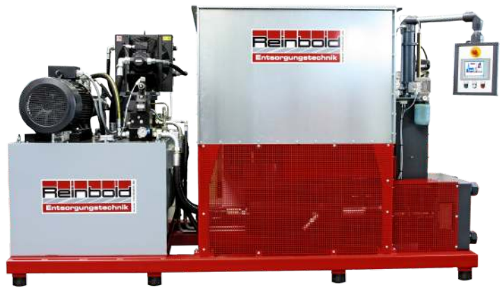
Option: stabiler Grundrahmen und Behälter