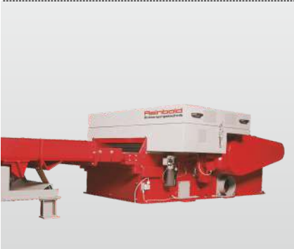
Baureihe RLZ 400 RHZ 1300 S: der Horizontalzerkleinerer für die horizontale Beschickung der Maschine