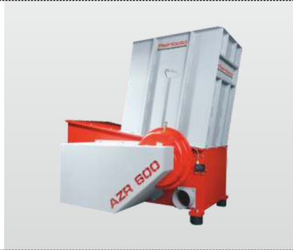
Baureihe AZR 600 AZR 600 S: der Universalzerkleinerer für Schreinereien